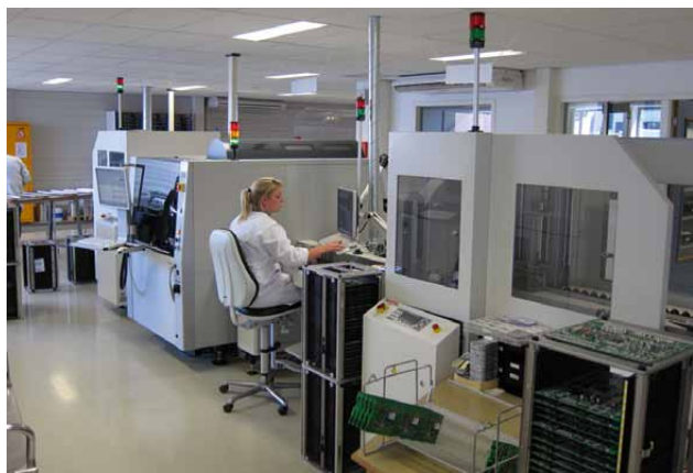
Einsatz der X7056 bei Rommtech in der Fertigung

Hat man bei Rommtech am Anfang noch hauptsächlich auf die AOI-Prüfung gesetzt, weil sie einfach visuell nachvollziehbar ist, so änderte sich das im Laufe der intensiven Arbeit mit der Technologie. Zunehmend werden auch die Stärken der automatischen Röntgenprüfung genutzt. „Wir haben erkannt, dass manche Fehler besser mit AXI als mit reiner AOI gefunden werden, z. B. der Heel eines SOIC. Durch die Hilfe der Viscom-Applikateure ist es uns gelungen, die automatische Röntgeninspektion effektiv einzusetzen“, so Rommens.